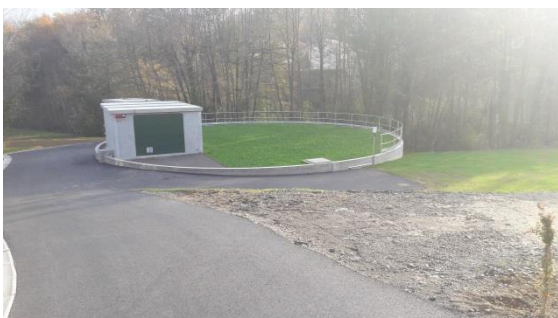
Bassin de stockage et de régulation à Brindas (1 200 m 3 )

Par Délégation de Service Public, Suez Eau France est l'exploitant des réseaux et de l'ensemble des ouvrages du SIAHVY, jusqu'au 30 avril 2020. Cette entreprise assure la maintenance, l'entretien et la surveillance des installations ainsi que la gestion des 8 111 abonnés (données 2017) dont les 753 abonnés de la commune de Sainte-Consorce.